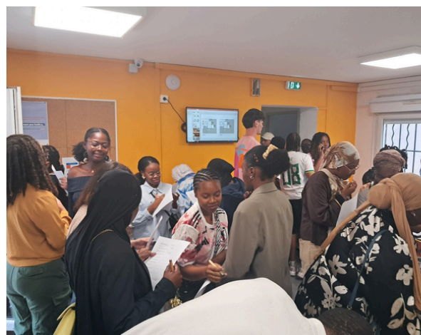
Semaine porte ouverte de solidarité DOM-TOM Hérault/CSF/ Journée réservée aux étudiants ultramarins

En 2025 le public étudiant représente 65,65 % des bénéficiaires.